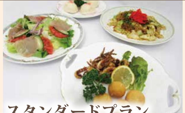
スタンダードプラン