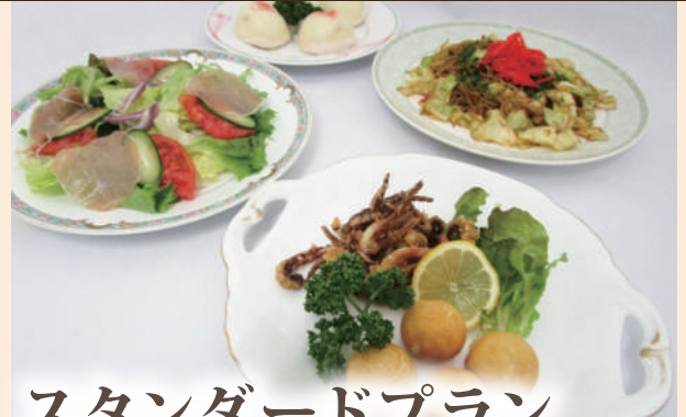
スタンダードプラン